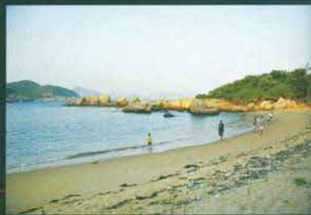
東澳的海灘是一個很漂亮的地方，卻充斥着垃圾，藝術家們就是從這些垃圾中，找到懂得「說故事」的東西。